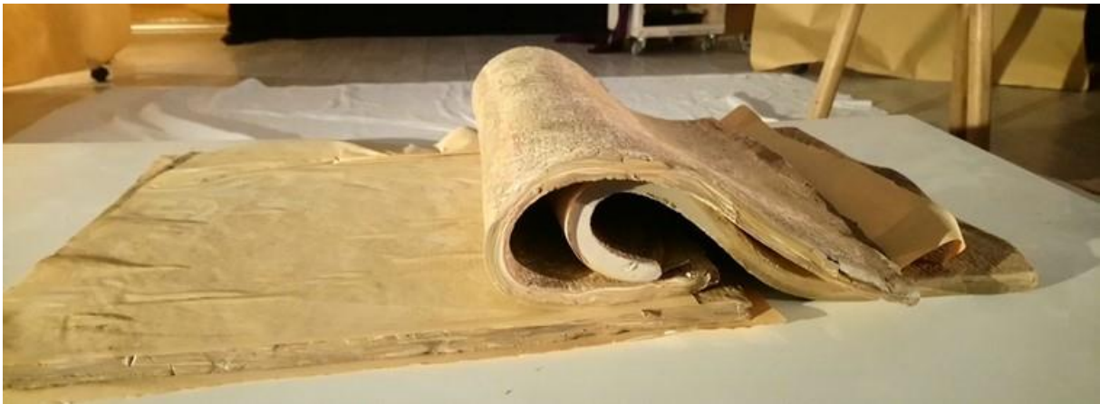
Recherche sur le livre d'argile

Un livre s'ouvre, se feuillette page après page, et se ferme. Le spectacle propose de jouer avec ce mouvement propre à la lecture du codex, en faisant émerger les matériaux contenus dans les feuilles qui tournent et qui s'échappent. La lecture devient alors construction, vers une mise en forme des matières, et vers une mise en jeu des sensations et des émotions du lecteur.