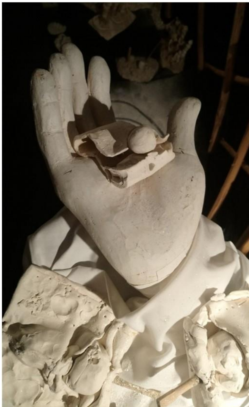
La main et l'enfant

Le temps pris pour tourner les pages devient la règle du jeu, celle de la lecture. Comme le livre, le spectacle s'ouvre et se ferme. Entre l'ouverture et la fermeture, nous travaillons à rendre perceptible le temps de la pensée en mouvement.