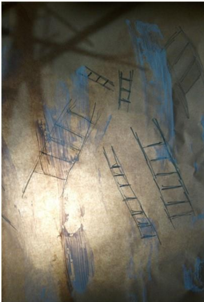
Élément de scénographie en construction