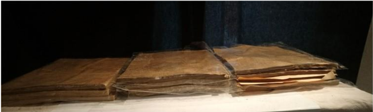
La table des matières