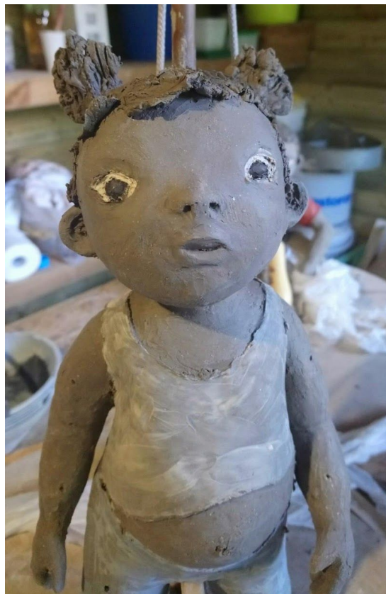
Sculpture "Corps en Regards" – Marie Tuffin